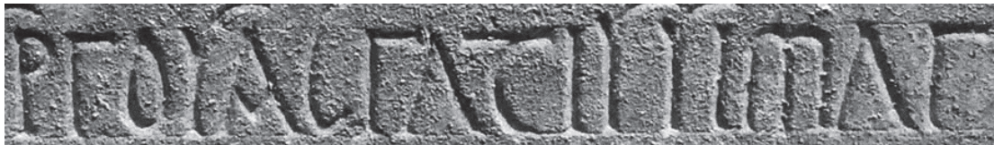
Fig. 3. Rescrit latin de Galilée: pro sacratissimaru[m] .

Quant à la désinence du génitif Mastauron , pour Μασταύρων , elle n'a rien d'anormal puisque, de tout temps, le O latin a transcrit indifféremment omicron ou oméga. 13 Une série remarquable de génitifs pluriels ainsi translittérés se trouve dans la table liminaire du Digeste, édité en 533. 14 Cet inventaire des traités des jurisconsultes, sources de la compilation justinienne, a été rédigé en grec mais il combine les deux alphabets et réserve aux titres des traités, pour mieux les faire ressortir, l'emploi de l'alphabet latin. Par exemple le juriste Julien est cité comme auteur de digesta en 90 livres: Ἰουλιανοῦ digeston βιβλία ἐνεθήκοντα, le génitif digeston étant la transcription du grec διγέστων, traduction du latin digestorum . De même dans les autres titres de traités dépouillés par les compilateurs du Digeste, la désinence grecque de génitif pluriel, -on pour -ων , remplace presque toujours la désinence latine. Ainsi les titres actionon , constitutionon , decreton , disputationon , edicton monitorion , instituton , opinionon , quaestionon , regularion ,