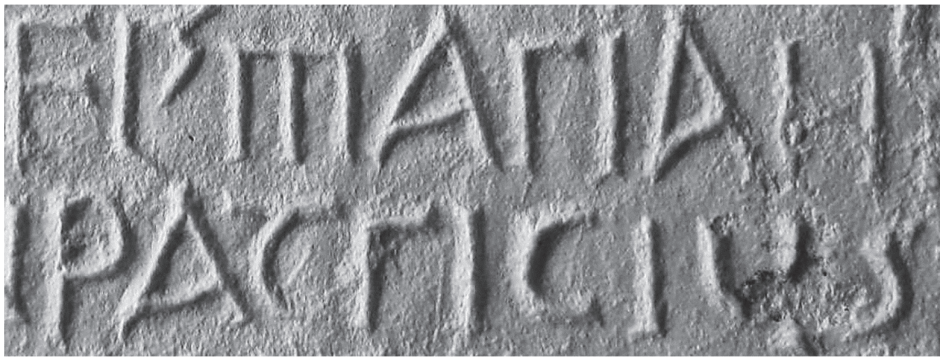
Fig. 2: I.Milet 3 , 1576, estampage A. Rehm: Marian(us) – Patricius . Photo: détail d'après I.Milet 3 , pl. 45.

À l'appui de cette lecture, il convient de noter une particularité paléographique propre à certaines inscriptions proto-byzantines, où le R latin revêt la forme anguleuse d'un Γ grec. Cette forme, qui tire son origine de la cursive latine tardive (et que perpétue de nos jours le r minuscule d'imprimerie), est attestée au second quart du VI e s. par deux autres inscriptions juridiques. Non loin de Magnésie, une inscription de Milet datant probablement des années 539–542 commence par un rescrit de Justinien et se termine par un édit du consulaire de Carie. Cet édit rédigé en grec est précédé, en latin, de la nomenclature développée du gouverneur: Fl(avius) Marian(us) ... Patricius ; 11 dans ces deux cognomina , la lettre R revêt la forme du Γ (fig. 2). On retrouve la même particularité à Batya en Galilée, dans un rescrit entièrement latin qui concerne l'asylie d'une église et date vraisemblablement de 534; le R y est constamment en forme de gamma, en particulier dans les mots pro sacratissimaru[m] regularum] tenore , où la même lettre est récurrente (fig. 3). 12 On voit qu'il ne s'agit pas là d'un phénomène accidentel, ni d'une mode étroitement locale, mais d'une stylisation typique des inscriptions latines de l'époque justinienne. C'est là un indice supplémentaire de l'époque, au moins approximative, de l'inscription de Magnésie.